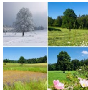
Moränenlandschaft Guldenen ZH Dauer 2-3 Stunden